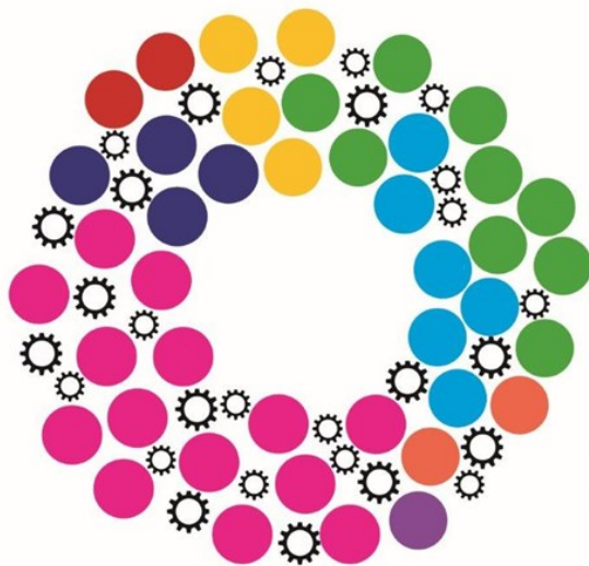
Figur 2. Samhällsutvecklingens kugghjul beskriver hur en mångfald av aktörer gemensamt skapar förutsättningar för utveckling.

Inom planeringsteorin brukar "governance" användas för att beskriva komplexiteten med att det är många parter och intressen inblandade i planerings- och utvecklingsarbete. 20 Figuren nedan illustrerar aktörerna som delar av ett kugghjul som gemensamt bidrar till samhällets utveckling. Kugghjulstanken tydliggör också det ömsesidiga beroendet, dvs. att varje aktör behöver förhålla sig till andra aktörer, deras uppdrag, ansvarsområden, mandat, bevekelsegrunder och drivkrafter. Samtidigt är det också viktigt att se att parterna är självstyrande, autonoma.